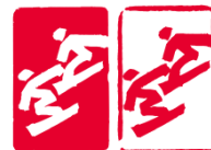
单板滑雪障碍追逐 (Snowboard Cross)