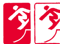
单板滑雪U型场地技巧 (Snowboard Halfpipe)