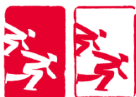
短道速滑 (Short Track Speed Skating)