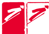
跳台滑雪 (Ski Jumping)