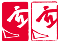
单板滑雪平行大回转 (Snowboard Parallel Giant Slalom)