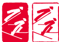
北欧两项 (Nordic Combined)