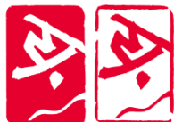
单板滑雪大跳台 (Snowboard Big Air)