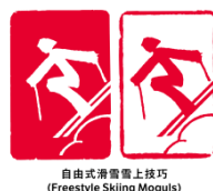
自由式滑雪雪上技巧 (Freestyle Skiing Moguls)