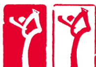
花样滑冰 (Figure Skating)