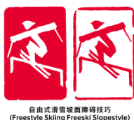
自由式滑雪坡面障碍技巧 (Freestyle Skiing Freeski Slopestyle)