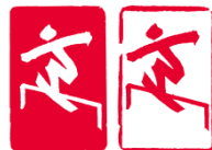
单板滑雪坡面障碍技巧 (Snowboard Slopestyle)