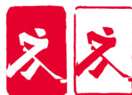
冰球 (Ice Hockey)