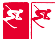
高山滑雪 (Alpine Skiing)