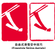
自由式滑雪空中技巧 (Freestyle Skiing Aerials)