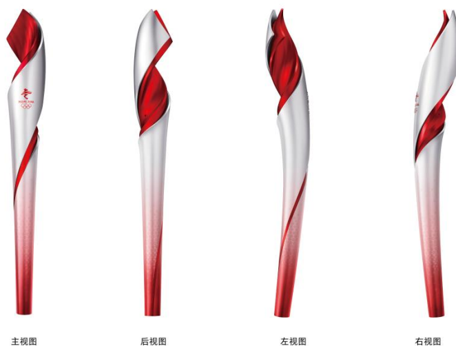
1. 主视图 2. 后视图 3. 左视图 4. 右视图