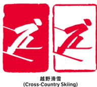
越野滑雪 (Cross-Country Skiing)