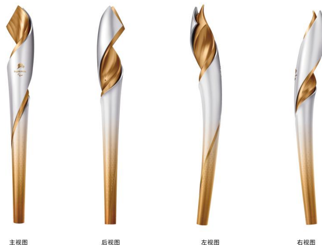
1. 主视图 2. 后视图 3. 左视图 4. 右视图