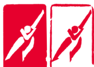
速度滑冰 (Speed Skating)